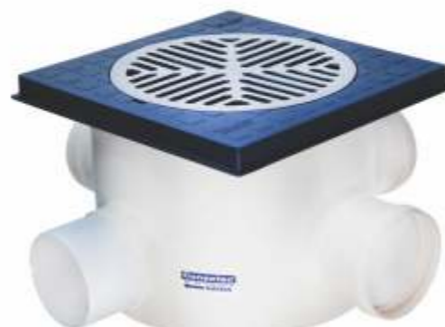
Material: PVC moldada Dn 300x215x100