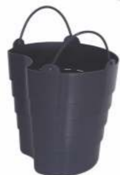
Cesto Material: PP

Material: ABS Dn 250x370mm Entrada: 3x50/75mm Saída: 100mm