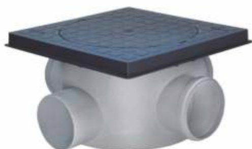
Material: ABS injetada Dn 250x180x100