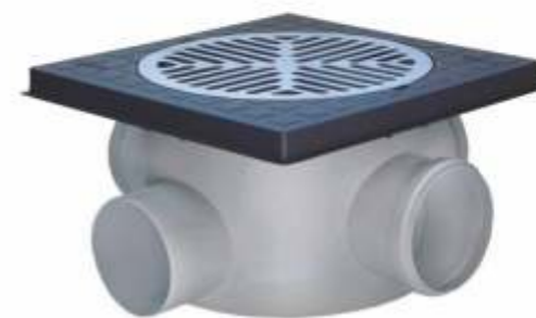
Material: ABS injetada Dn 250x180x100