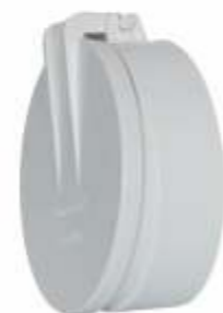
Válvula de Retenção Dn: 100mm