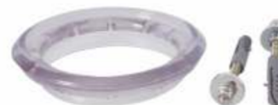
Anel de Vedação p/ Vaso Sanitário Dn: 100mm