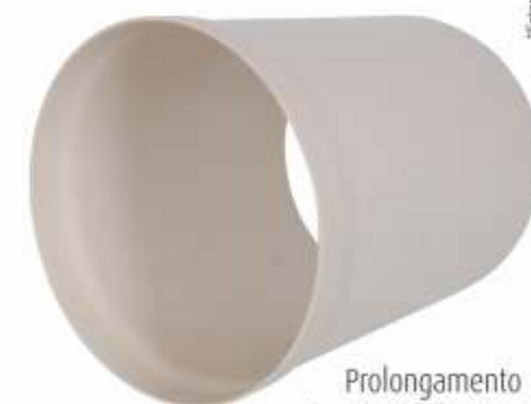
Prolongamento Dn: 150 a 300mm Comp.: 200 a 500mm