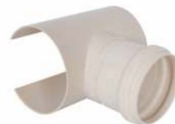
QG Selim Dn: 100x100mm Dn: 100x75mm Dn: 100x50mm