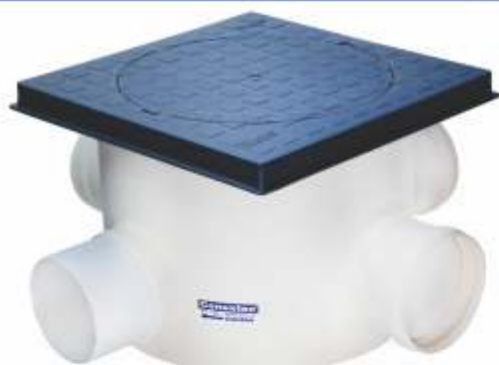
Material: PVC moldada Dn 300x215x100