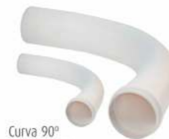
Curva 90° Dn: 40 a 400mm