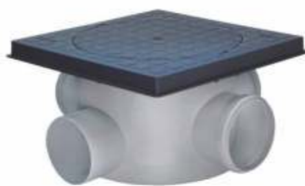
Material: ABS injetada Dn 200x180x100