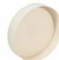
Cap Esgoto Branco Dn: 100 a 300mm