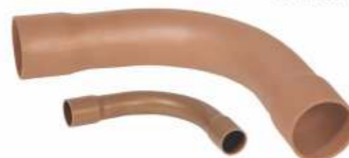
Curva 90° PBA e PBS