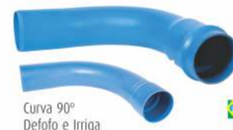
Curva 90° Defofo e Irriga