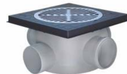
Material: ABS injetada Dn 200x180x100